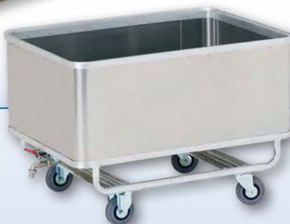
Transportwagen wasserdicht mit Ablaufhahn