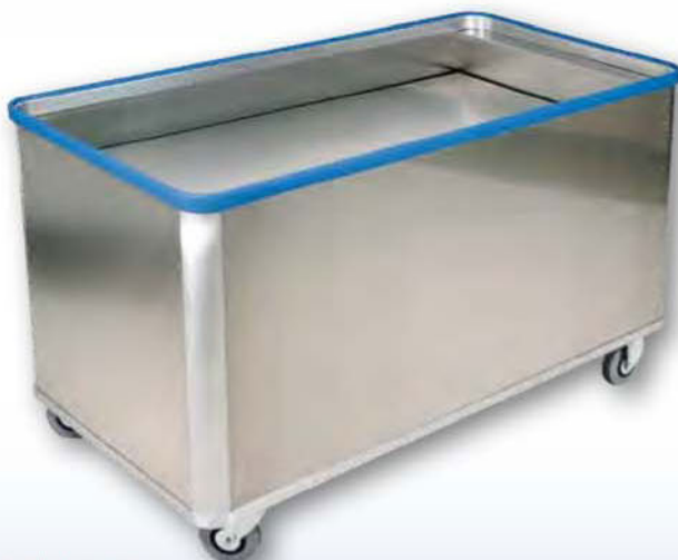
Modell D 5408 / 580