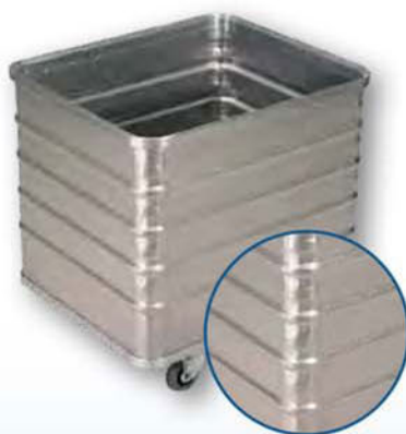
Modell D 3008 / 240