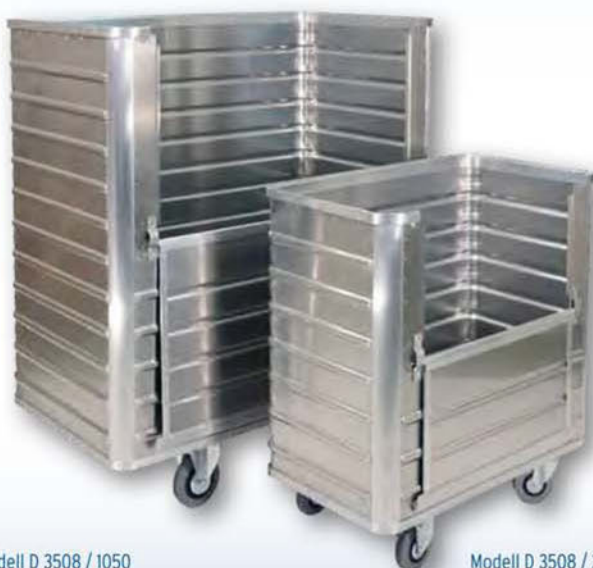
Modell D 3508 / 1050