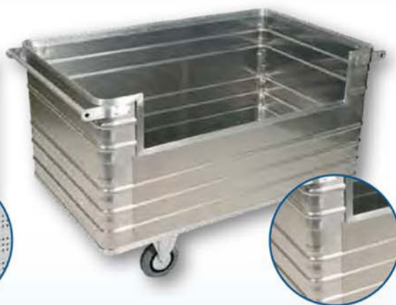
Modell D 3808 / 945