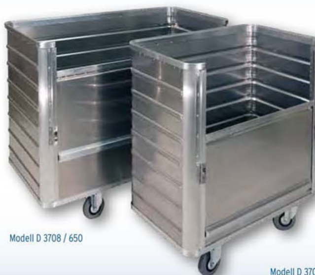
Modell D 3708 / 650