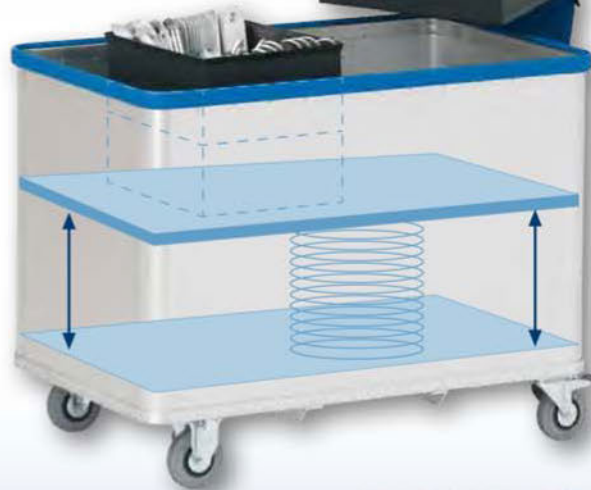
Modell D 1408 / 350 - eloxiert

Der lastabhängig, fliegend aufgehängte Boden wird in Spezialprofilen einer Wagen-Stirnseite verkantungsfrei geführt. 8 kugelgelagerte Rollen sorgen für eine präzise Parallelbewegung des Federbodens. Glatte Wände reduzieren die Reibung des Ladegutes und begünstigen die sofortige Reaktion des Federbodens auf Gewichtsveränderung.