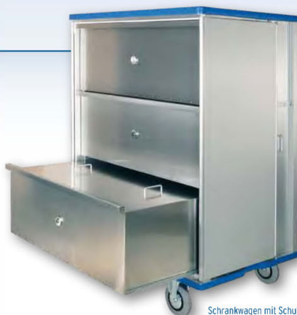
Schrankwagen mit Schubladen auf Teleskop-Auszügen