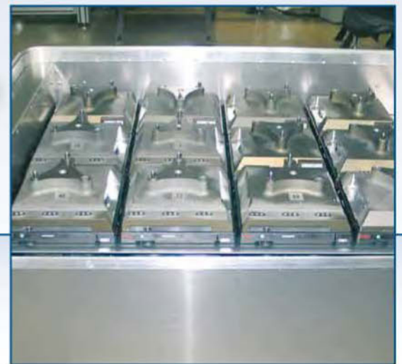
Beladen mit Komponenten für Motorblock