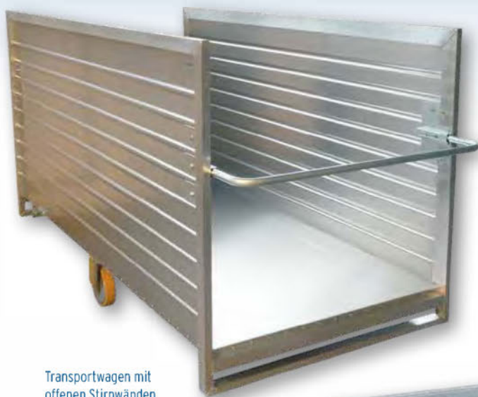
Transportwagen mit offenen Stirnwänden