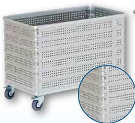
Modell D 3008 / 430 P