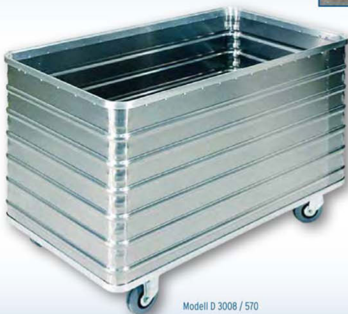
Modell D 3008 / 570